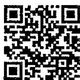
หนังสือรับรอง