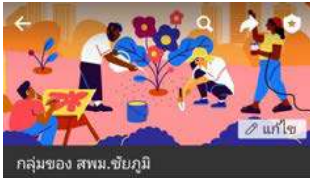
กลุ่มของ สพม.ชัยภูมิ